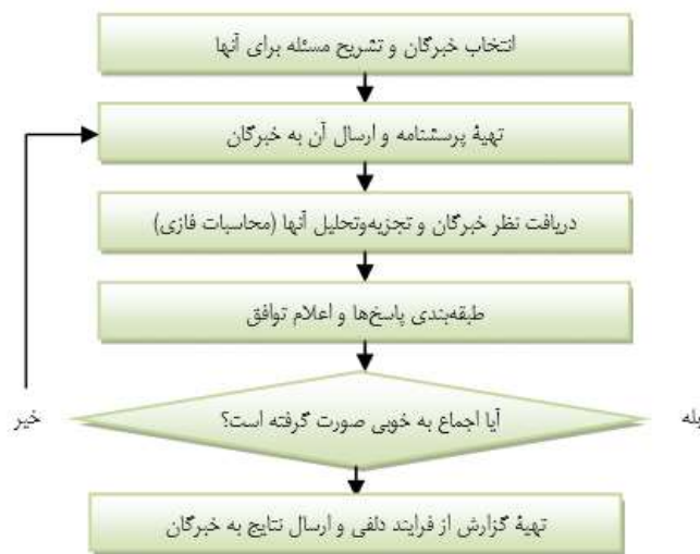
شکل (۳): الگوریتم اجرای روش دلفی فازی

مراحل به‌کارگیری روش دلفی فازی در ادامه آمده است (چانگ، ۱۹۹۸). می‌توان تابع مثلثاتی فازی مربوط به هر شاخص را از پرسشنامه خبرگان و بر اساس فرمول‌های زیر به دست آورد: